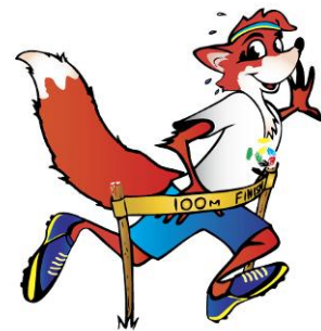
Лисеня Тімо – веселий герой освітніх матеріалів проекту "Fair play - Чесна гра"

Головним товаришем і порадиником читачів африканської версії підручника був мангуст Едвін (Edwin – Education and Winning). Символом української версії проекту стало життєрадісне, спритне і доброзичливе лисеня на ім'я Тімо.