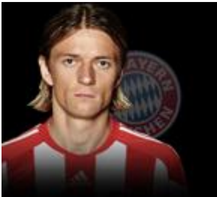
Анатолій Тимощук – зірковий Посол доброї волі проекту "Fair play - Чесна гра"

Відомий український футболіст Анатолій Тимощук став першим Послом доброї волі проекту "Fair play - Чесна гра". Анатолій Тимощук є гравцем основного складу збірної України, чемпіоном трьох країн: України, Німеччини та Росії, володарем кубку УЕФА, Заслуженим майстром спорту, заслуженим працівником фізичної культури та спорту