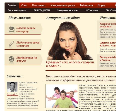
Незабаром в Інтернеті: національний інформаційний ресурс для ПКС

Веб-сайт запропонує користувачам актуальну інформацію з питань законодавства, прав людини, профілактики ВІЛ та ІПСШ, споживання наркотиків, протистояння насильству та інших тем у контексті надання сексуальних послуг, надасть можливість отримати консультації експертів, взяти участь в опитуваннях та поділитись власною історією.