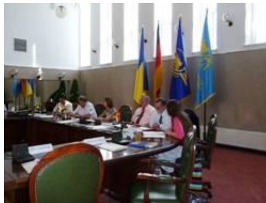
Представники Львівської залізниці, LHSI та GIZ домовились про співпрацю з профілактики ВІЛ/СНІДу

Проект втілюватимуть на теренах Львівської, Тернопільської та Чернівецької областей.