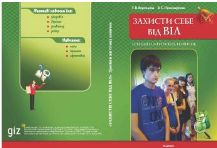
Посібник «Захисти себе від ВІЛ»

Метою конкурсу було популяризувати серед молоді міста та області гармонійний та здоровий спосіб життя, сприяти особистому його сповіданню, свідомому ставленню до збереження та зміцнення власного духовного та фізичного здоров'я; активізувати внутрішні потреби для розкриття власного творчого потенціалу й протистояння негативним тенденціям сучасності; ознайомити з первинною профілактикою ВІЛ/СНІДу та інфекцій, що передаються статевим шляхом; виховувати почуття відповідальності за культуру ставлення до свого здоров'я та навколишнього середовища