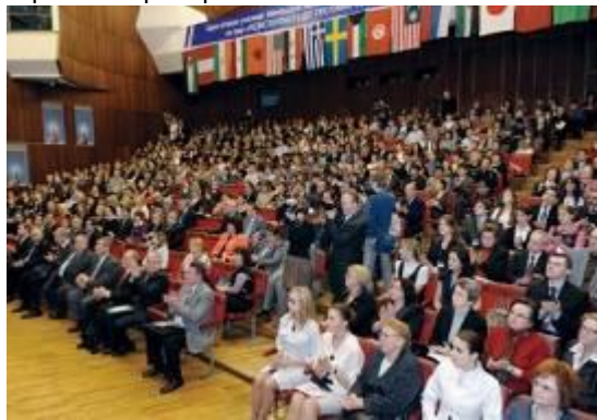
У Національному медичному університеті відбулась міжнародна конференція «Резистентність до протимікробних препаратів та її глобальне поширення»

До Всесвітнього дня здоров'я в Національному медичному університеті (НМУ) ім. академіка О.О. Богомольця відбулися масштабні науково-практичні заходи: дводенна науково-практична конференція «Резистентність до протимікробних препаратів та її глобальне поширення», організована спільно МОЗ, Національною академією медичних наук (НАМН) України, Європейським регіональним бюро ВООЗ та НМУ ім.Богомольця та спільний тренінг НМУ імені О.О. Богомольця та Каролінського інституту (Стокгольм, Швеція) «Актуальні питання резистентності до протимікробних препаратів».