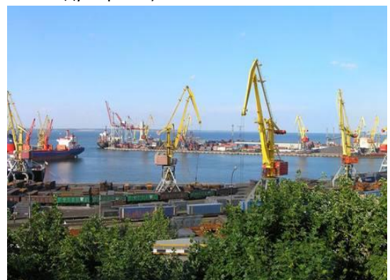
GIZ проведе дослідження серед працівників морського транспорту

Перемовини показали значний інтерес сторін до провадження профілактичних програм з ВІЛ/СНІДу в