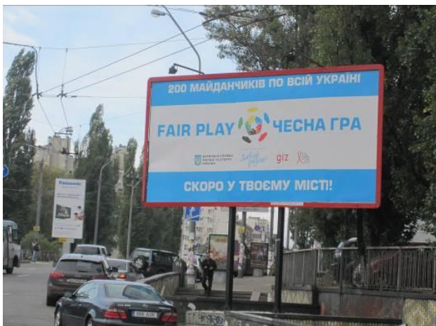
На 200 майданчиків по всій Україні молодь з нетерпінням чекає на тренерів

На початку жовтня у Києві стартувала рекламна кампанія компоненту «Чесна гра» Національного соціального проекту до Євро-2012 «Давай разом!». 25 білбордів уже з'явилися у Києві. До кінця 2011 року кампанію буде поширено й на інші регіони.