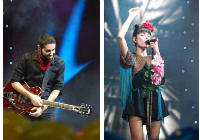
Іспанський гурт «Fuel Fandango»

Україні, ВБФ «Міжнародний Альянс з ВІЛ/СНІД», ВБО «Всеукраїнська мережа людей, які живуть з ВІЛ/СНІД», ЮНЕЙДС, ЮНФПА, ВСГО «Рух за здоров'я» та ін.