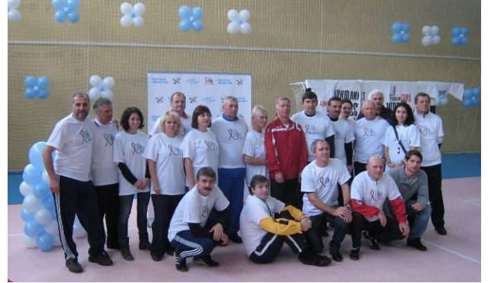
Інструктори проекту «Чесна гра» в АР Крим

Президент Республіканської федерації футболу Криму, Аделін Гоне, Керівник Представництва ПРООН в АР Крим, Сергій Шевченко, автор "Золотого голу України" та найкращий футболіст 1992 року.