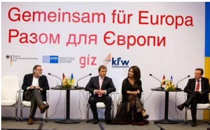
Круглий стіл «Давай разом!Чесна гра»

Ганс-Юрген Гаймзют, Посол Федеративної Республіки Німеччина в Україні, Равіль Сафіуллін, Голова Державної служби молоді та спорту України, Мартін Каде, Керівник Програми профілактики ВІЛ/СНІДу, GIZ, Хайко Яннерманн, Директор KfW бюро в Україні та чарівна Гайтана, Посол Доброї волі проекту «Давай разом!Чесна гра» розповідали про успішну співпрацю у розвитку юнацького футболу заради спільної мети - створення умов убезпечення дітей та молоді від шкідливих звичок та виховання в них відповідального ставлення до своїх рішень і вчинків, прищеплення їм духу здорового способу життя.